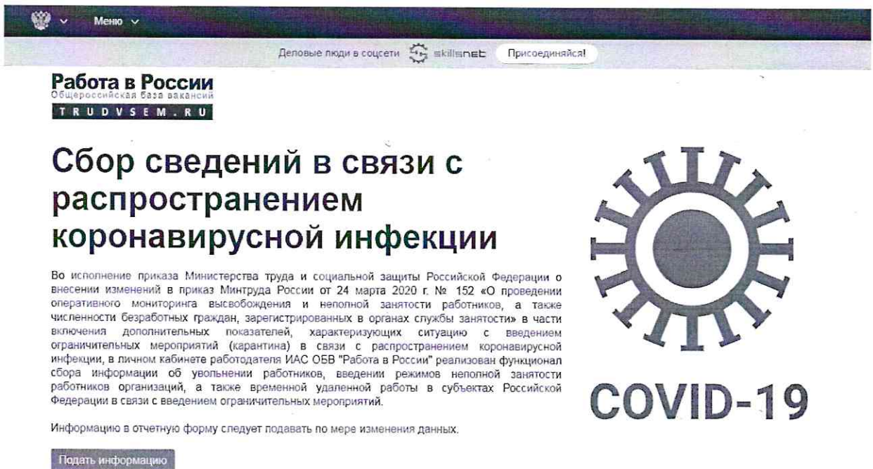
Рис. 2. Информационная страница